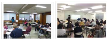
がんピアサポーター育成研修(登米・仙台・石巻)