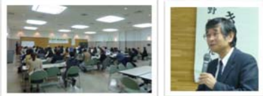
がん患者・家族のつどい