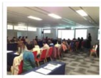
宮城県がん患者会・サロン情報交換会