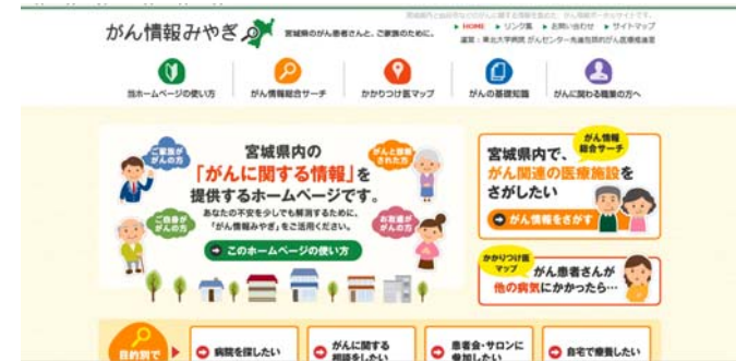
宮城県版がん情報ポータルサイト