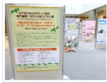
みやぎのがん患者支援団体パネル展